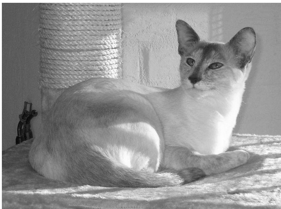
Bali-Kitten's Arven "Diva"

Vi fik et stamnavn – DK Balisia, tog på udstilling med Diva og i løbet af foråret 2005 købte vi en brunmasket balineserhunkat fra Gypsy Star – Dorian Nemus, han skulle være vores avlshan, når han blev gammel nok. Så var vi klar. Da Nemus endnu ikke var gammel nok, fik vi Diva parret med Bali-Kitten's hunkat "Timon", og hele familien ventede spændt. Vi holdt øje med Divas mave, og hun blev kræset for og hygget om.