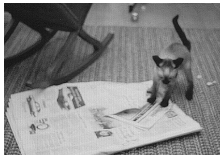
Yang i færd med "at læse avis". Bemærk knækket på halen.

Mine forældre havde haft overnattende gæster.