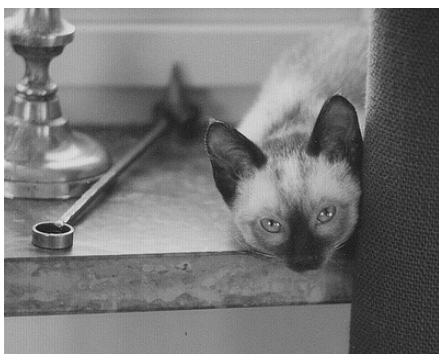
Yang 1980 "Bølle-charmetrold".

En formiddag ringede mor, og jeg kunne ikke forstå andet, end at noget skrækkeligt var sket. Efter mange hulk og hik kom det frem.