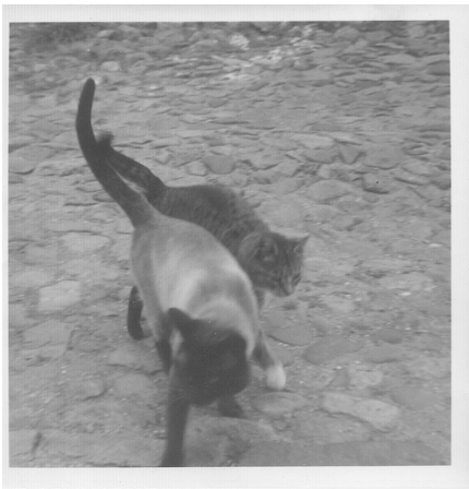
Thai, kæmpe stor med dyb stemme. Huskatten ved siden af var ikke en lille kat!

Yin og Yang var vidunderlige! Min far havde egentlig aldrig brudt sig særlig meget om mors katte, men med Yin og Yang var det noget