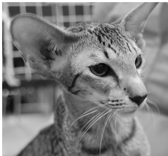
Sweetie's søster, Silvanest Hisimë OSH n 24