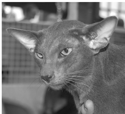
GIP Kattilan Twinkletoes OSH a