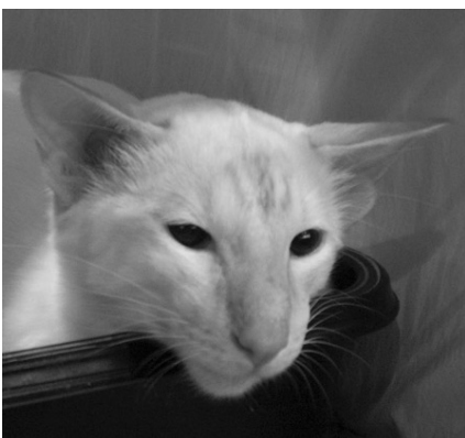
Miraculix av Karitzzy BAL d 21

vedpersonen selv tog det nu ganske roligt – han faldt hurtigt til ro og lagde sig til at sove, og først da vi skulle skifte tog, blev han igen urolig. På flyveturen var det kun under op- og nedstigningen at han var urolig – mon ikke han har haft lidt trykken for ørene ligesom vi andre ?