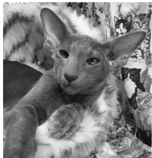
Kattilan Starfighter OSH a, BIS 3-6 søndag

De 2 udstillingsdage fløj af sted, og det var selvfølgelig rigtig hyggeligt at hilse på en masse af de opdrættere jeg indtil da kun havde stiftet bekendtskab med via deres hjemmesider. Om søndagen var der rigtig stemning, da der kom sms'er med resultater fra SW i Sverige – indtil flere finsk opdrættede katte havde klaret sig flot, så der var jo jubel.