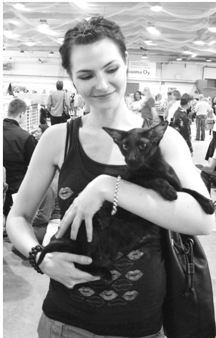
Sultsinan Satumaa OSH n

nen. Box var en smuk brunmasket hunkat ved navn Kelmikerhon Tummaa Magiaa, JW SIA n. Også i kastratrækken var der nogle smukke katte, men for Mia var det en rigtig god dag, og hendes kastrathan EP Silvanest Amadas, DSM SIA b blev BIS og Box var en hunkastrat ejet af Mias veninde - en ebony ved navn EC Sultsinan Satumaa OSH n.