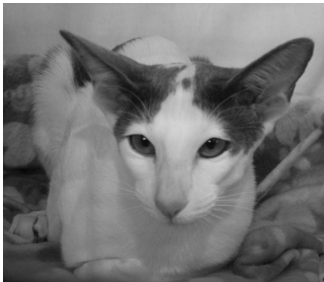
Skazki Henrietta OSH a02

Udstillingen var ikke så stor, og efter finsk målestok var mængden af kategori IV katte ikke så voldsom. Men jeg talte i alt 49 kategori IV katte om lørdagen – af disse var 34 orientalerne, 2 Peterbald, 1 Orientalisk Langhår, 2 Seychellios og kun 10 siamesere!!