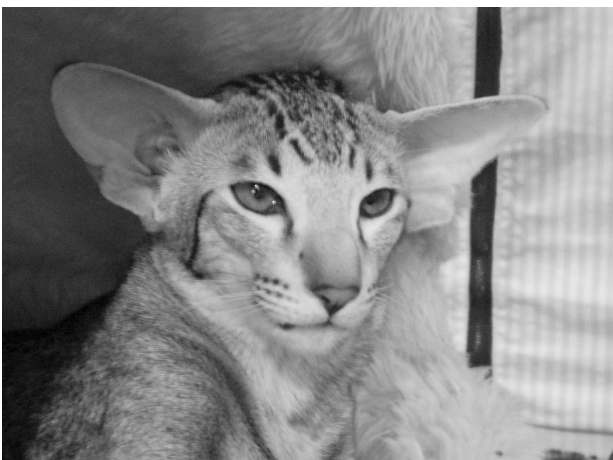
Sweetie's bror, Silvanest Hador OSH b 24, NOM begge dage

Sådan en togrejse med en kat er faktisk meget morsom – der er ikke grænser for, hvor snakkesalige folk bliver, når de opdager, man har en kat med i tasken, og kommentarer som "Guuud – jeg troede det var et barn, der kom med de lyde" og "Sikke store ører den har – skal den se sådan ud" kom der mange af lige i starten af turen. Ho-