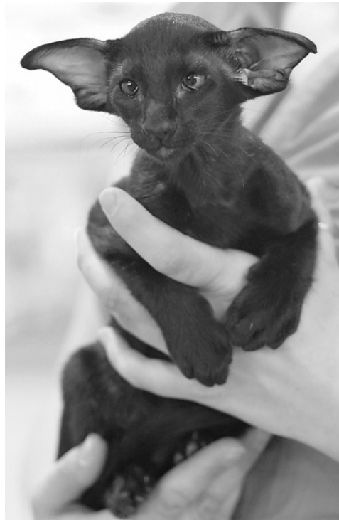
Piltoft's Jameel OSH n

På udstillingen lagde han sig bare til at sove i buret, bortset lige fra de første par timer, hvor alle jo skulle hen for at se på ham. Folk er jo nysgerrige, når der sådan kommer en ny import til landet.