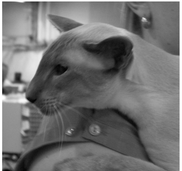
Silvanest Fidelio SIA a, BIS voksen begge dage