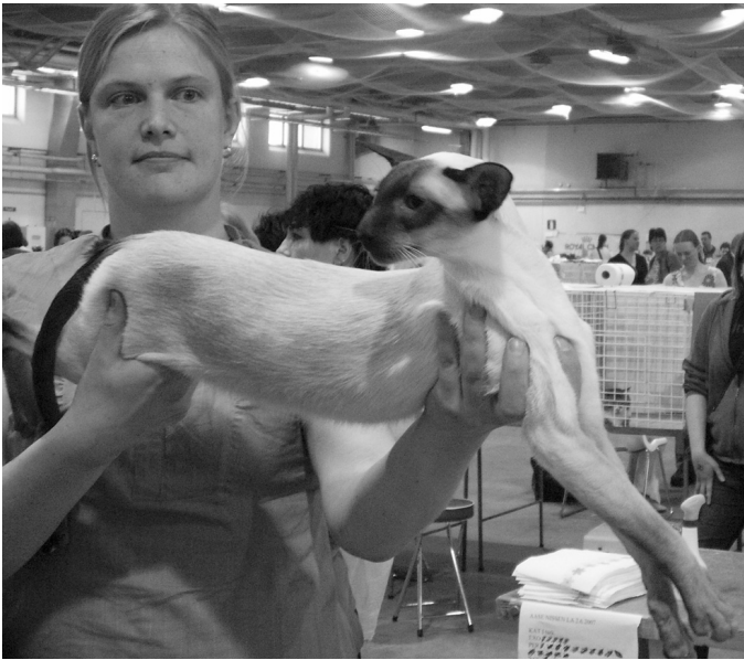
Silvanest Amadas SIA b, BIS kastrat begge dage