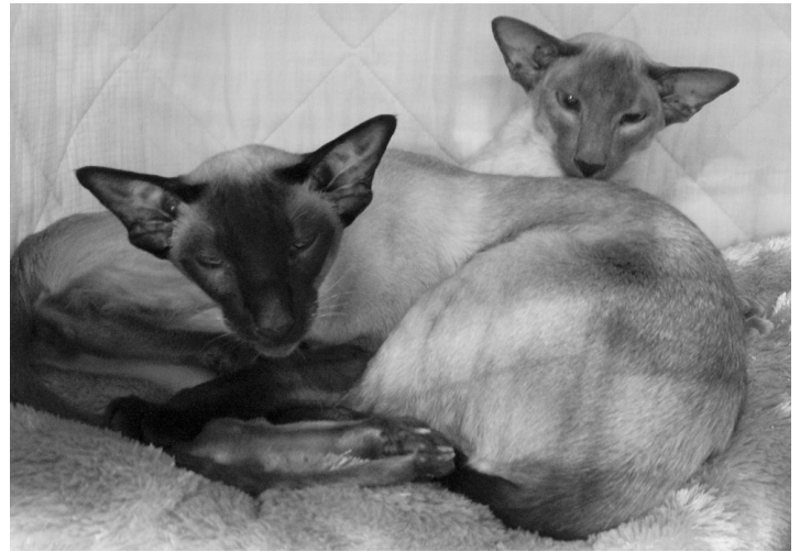
Kelmikerhon Tummaa Magia, JW SIA n (forrest) Kelmikerhon Salonkileijona SIA a (bagerst)