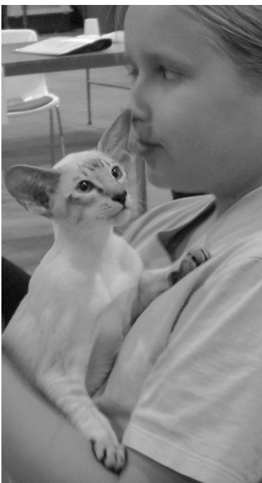
Pinokin Halo SIA n 21, NOM lørdag