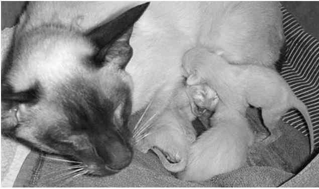
Bella med killinger, sommeren 2007

katte, 1 hankat og en hunkastrat. Men både af hensyn til pladsen og til min alder er jeg desværre nødt til at begrænse mig lidt, så selv om jeg gerne ville beholde killinger fra hvert eneste kuld, eller købe nye katte, så forsøger jeg at passe på, at mit opdræt ikke vokser mig over hovedet.