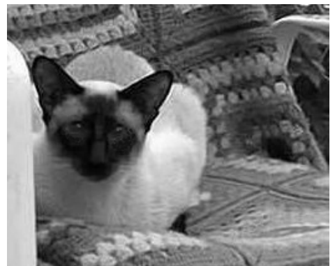
Troldkær's Ariel Brown Esquire SIA n