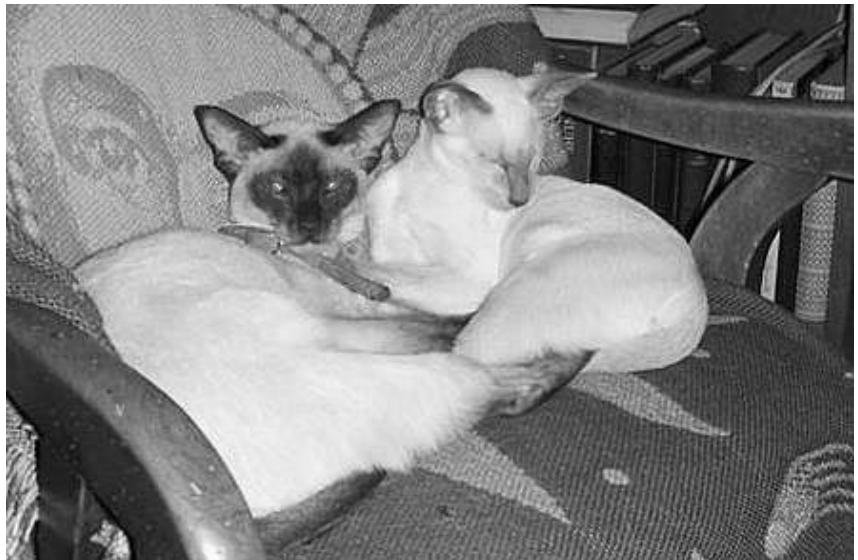
Bella (Bellamis Stolichnaya SIA b) tv. My (Klingeskov's Mytilene SIA c) th.

Jeg har p.t. 6 voksne katte i mit katteri med 2 hunkatte i avl, 2 unge hun-