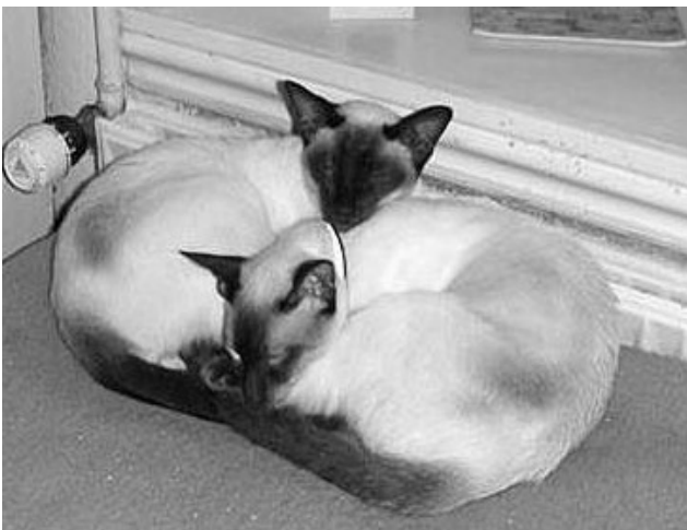
Bella og Ringo nyder hinandens selskab

Min egen dumhed med fritgående katte! Efter at have mistet 2 katte pga. aids og 3 katte pga. leukæmi,