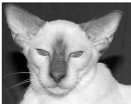
Haslund's Claudius SIA b

Vi har solgt mange katte, blandt andet til Østrig, Tyskland samt Italien - nogle af dem er solgt som kælekatte, andre er blevet brugt til avl.