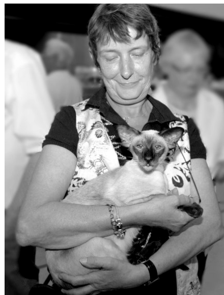
Haslund's Albert SIA n

Haslunds Hulda efter samme kombination og selvfølgelig vores nye kat Nannini v. Warantharpa OSH n. I skrivende stund venter vi killinger med Haslunds Natasja SIA n og EC Bellamis' Finlandia OSH b, og det glæder vi os meget til.