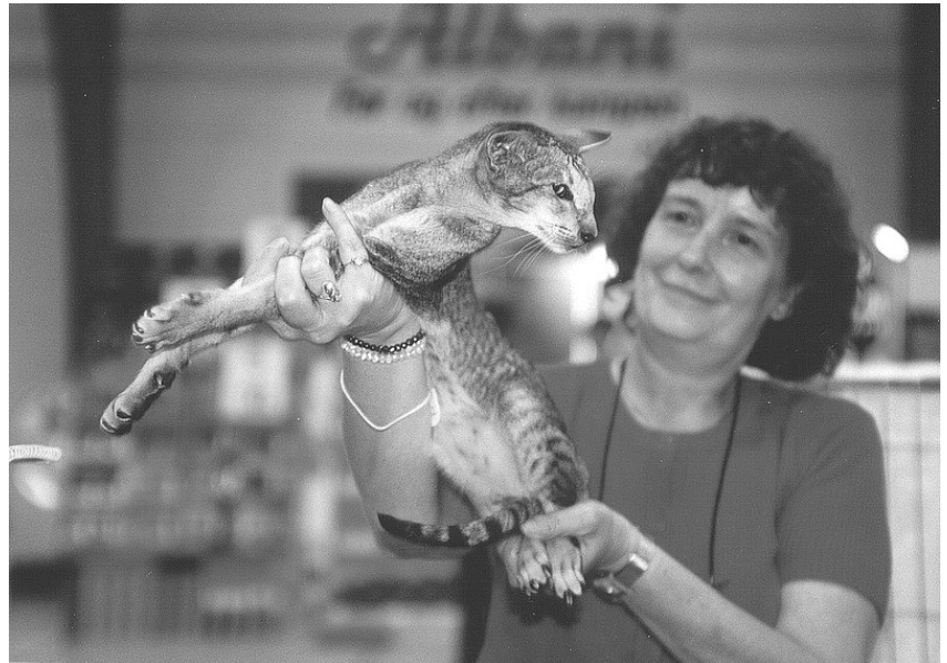
WW’96’97’98’99 EP Haslunds Indiana Jones OSH n 24