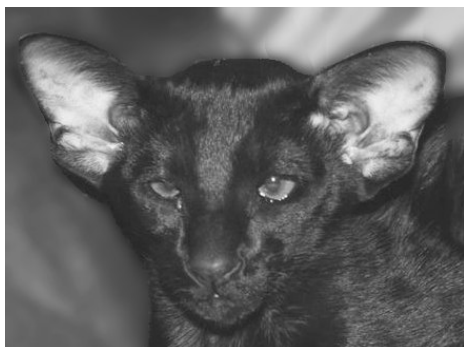
Nannini v. Warantharpa OSH n

IC Haslunds Natasja SIA n – brunmasket siameser, mangler et certifikat i at være Grand International Champion. GIP Luana v. Warantharpa SIA a, er på vej til at blive Europa Premier og CH Haslunds Yasmin SIA b – chokolademasket siameser, er blevet Champion.