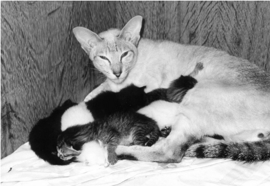
Madame Butterfly med killinger

Tato blev far til Haslunds Madame Butterfly SIA n 21, som blev mor til vores næste verdensvinder. Hun blev nemlig parret med Ayanth Diacanthus