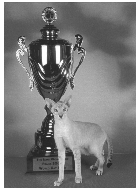
WW’00 EC Haslunds Tato SIA n 21

ge savnet, da de desværre er døde. På et tidspunkt lærte vi en ung italiener at kende. Han havde en hunkat, EC Okonor Rozsa Sandor SIA b – chokolademasket siameser - ham fik vi lov til at købe en parring fra. Han blev parret med Sodemarkens Ronja Røverdatter SIA n 21, og det resulterede i et kuld, hvorfra vi beholdt en hunkat, nemlig WW’00 EC Haslunds Tato SIA n 21- bruntabbymasket siameser - som i øvrigt blev verdensvinder 2000 i Prag, Tjekkiet.