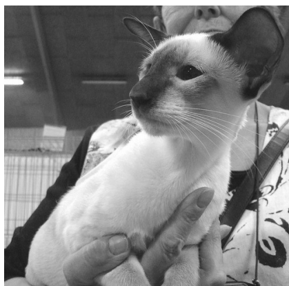
Haslund's Yasmin SIA b

De nye katte, som vi venter meget af, er førnævnte Yasmin efter IC Haslunds Natasja SIA n og EC S*Limericks Working Class Hero, DSM SIA n.