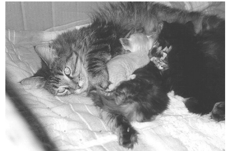
Maine Coon som amme mor

Vi har som de fleste andre også haft huskat.