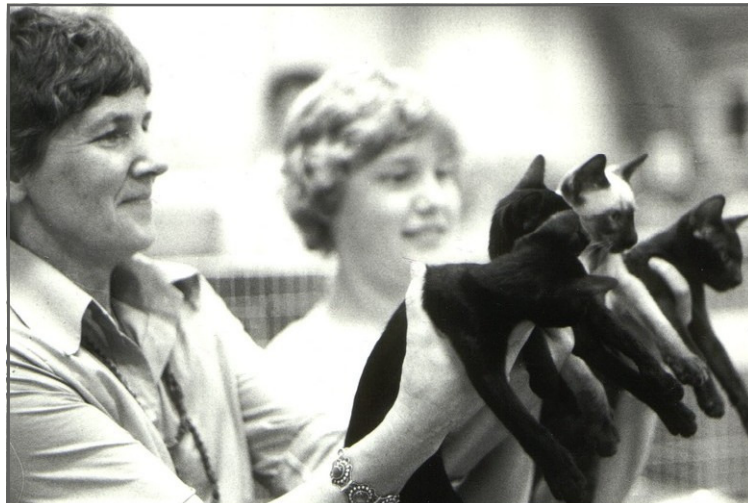
Vores første orientalerkuld efter Bolette og Benjamin af Bajang blev BIS

Har opdrættet siden 1972, siamesere, orientalere, nu også bicolor