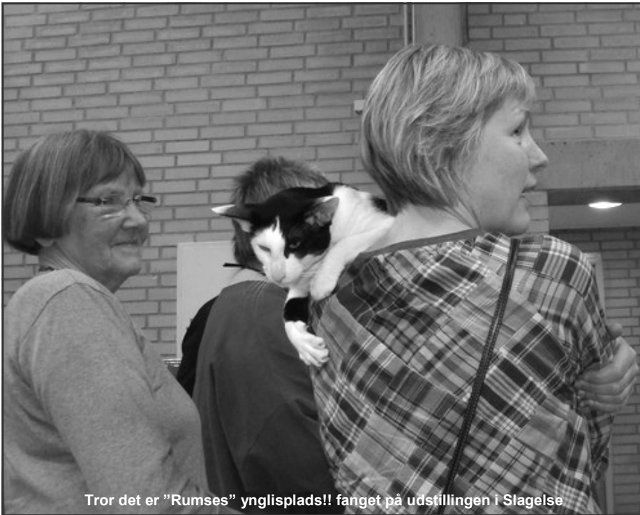
Tror det er "Rumses" ynglisplads!! fanget på udstillingen i Slagelse

Her er vi så nu! - mange erfaringer rigere, klogere på avl, genetik, bredere skudre m.m.