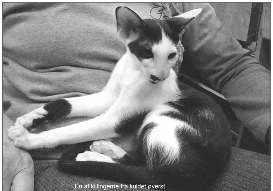
En af killingerne fra kullet øverst

hun døde grundet cancer kun få år efter jeg havde fået hende og min avl gik i stå igen. Jeg havde i en periode haft et øje på bicouloren, selv om jeg egentlig søg-