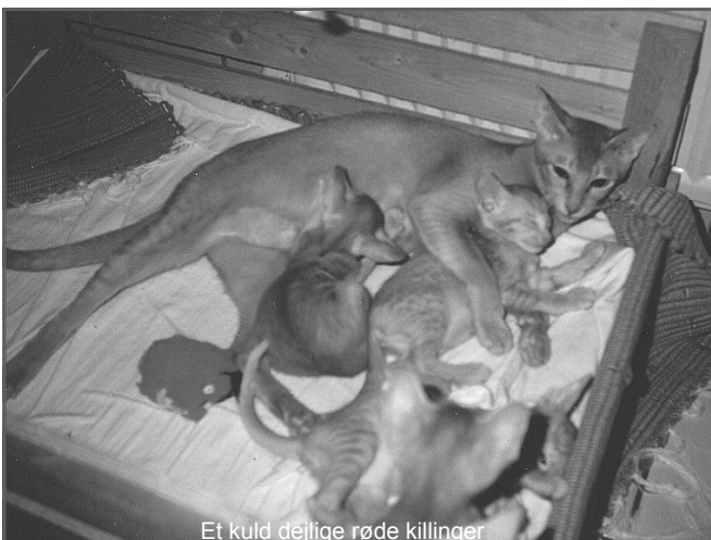
Et kuld dejlige røde killinger

Pegasus Galant, en af datidens mest kendte og vindende siam/orientaler, og et skønt kuld kom til verden: 2 Ebony, 1 havana, som blev solgt til avl i Tyskland og 1 chokolademasket siam, som blev solgt til kæl. Det kuld blev BIS over flere andre siam kuld. De 2 ebonyer er blandt de første 4 fødte ebonyer i Danmark. Bolette af