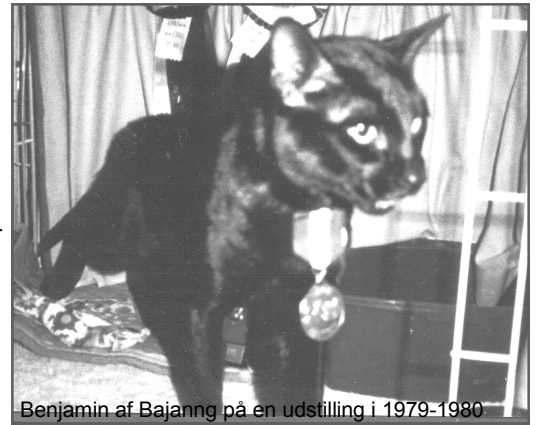
Benjamin af Bajang på en udstilling i 1979-1980

Samtidig forelskede min mor sig i en smoke orientaler, og hun startede herefter et sideløbende avl af smoke. Desværre var vores smoke avl forfulgt af uheld med bl.a. mange dødfødte killinger, killinger som døde i ung alder, bl.a. pga hjerte-fejl og megen sygdom blandt de smoke linjer. Så efter nogle år stoppede min mor den smoke avl. Herefter lå avlen