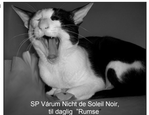
SP Várum Nicht de Soleil Noir, til daglig "Rumse"