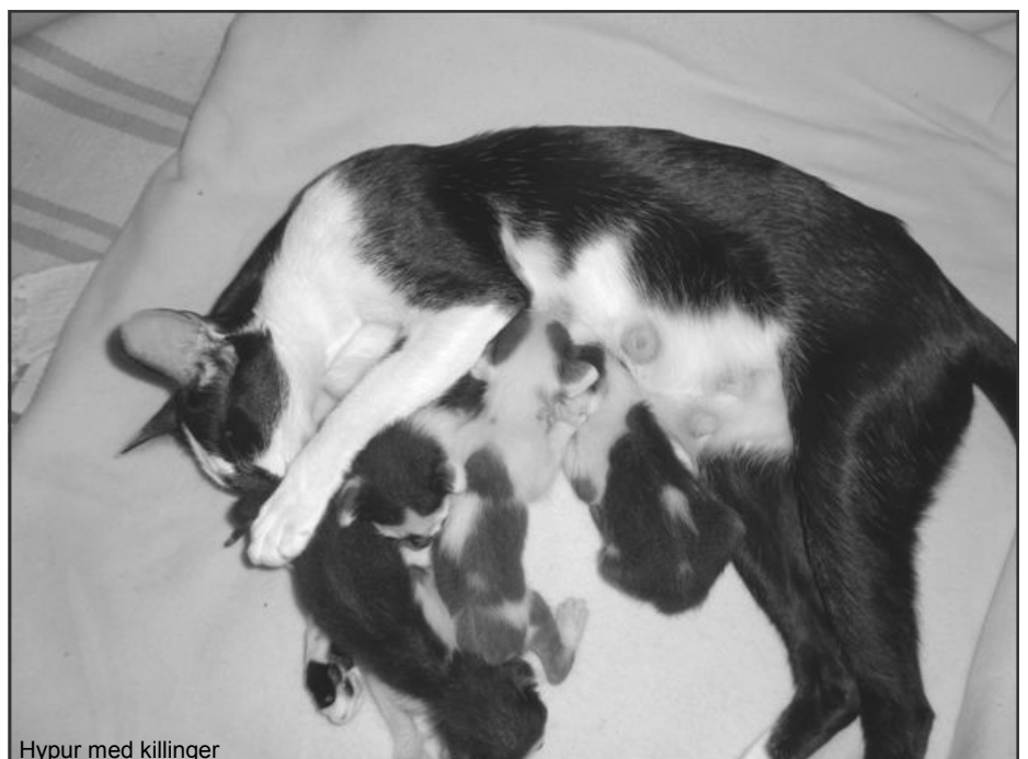
Hypur med killinger