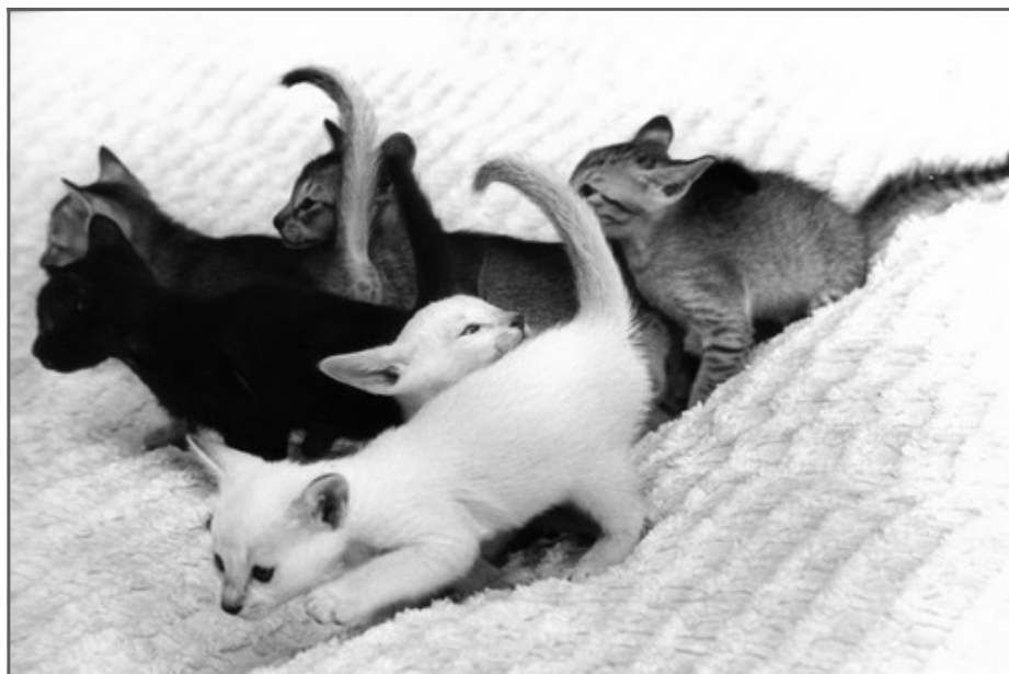
Et af Nicolines mange kuld