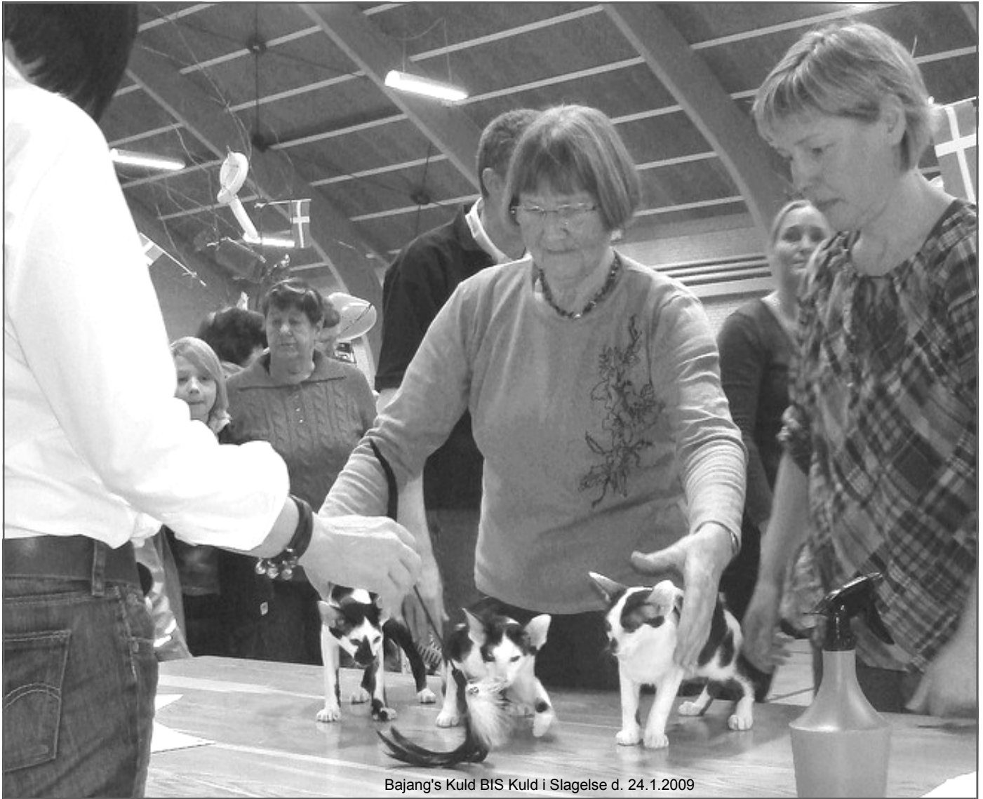
Bajang's Kuld BIS Kuld i Slagelse d. 24.1.2009

til, at flere røde orientaler blev omregistreret til rødspottet orientaler. Tinka blev mor, mormor o.s.v. til mange røde orientaler, de fleste solgt til kæl men enkelte til avl. På grund af, at jeg var alene om den røde avl, kom jeg til at mangle en god hankat for at komme videre, den røde avl gik derfor stille i stå igen. Den sidste af disse sover stadig under min dyne. Dild er i skrivende stund 15 år gammel.