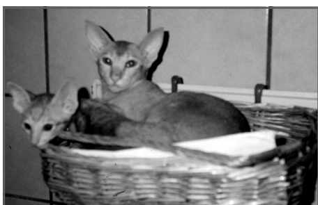
Dild af Bajang, er nu 15 år og den sidste af mine egne

Sidder her en meget tidlig morgenstund med min morgente, tænker - skriver!