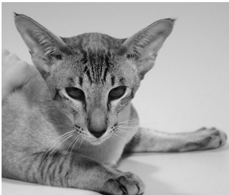
Zafiramis Hektor SIA n 21