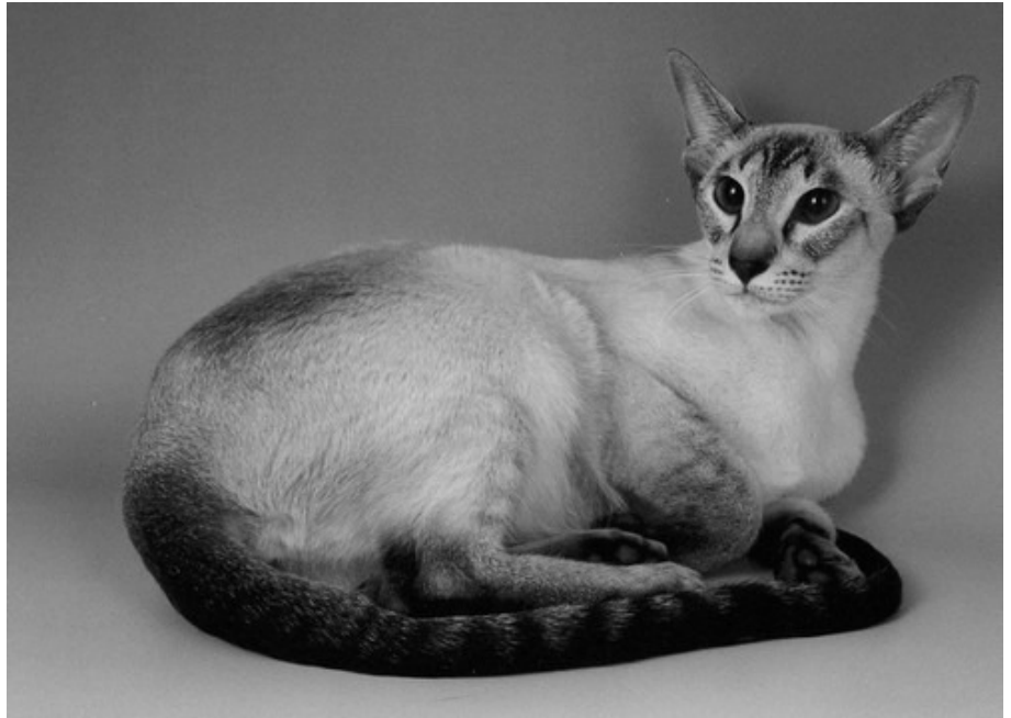
Zafiramis Blance SIA b 21