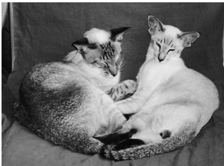
Allegetto's Urlus og Zafiramis Hector

I september 2004 var vi på udstilling i Kristianstad, hvor Hector blev IC, og hvor vi fik øje på en frisk chokoladetabby hunmis. Hun kunne ikke forsvinde fra erindringen efter udstillingen, og efter lidt snakken frem og tilbage kontaktede vi ejerne i Annelöv ved Landskrona med det resultat, at