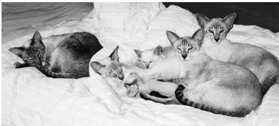
Julius, Blance, Carmen, Hector og Zafiramis I kuld