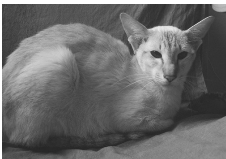
Annelövs Achara SIA b 21

vi alle tre drog over for at se på de to hunnisser, der var til salg. Til alt held valgte vi den rigtige, det viste sig senere, at søsteren fik livmoderproblemer og ikke kunne få killinger. Vi fik Annelövs Achara SIA b 21, og med hende var det ligesom at få en sol i huset med hendes lyse farver. Både Carmen og Hector var meget mørke i farverne, og hensigten med købet af Sara var at komme lidt væk fra det. Vi tog hende med på udstillingerne sammen med Hector i 2005, hun fik certifikat hver gang og blev GIC. Vindertitlerne kneb det mere med, hun blev nomineret to gange, begge af Peltonen, og den ene af gangene blev hun BOX, det var det. Hun er lidt uharmonisk i kroppen. Til gengæld blev hun familiens mormis no. 1, altid meget omsorgsfuld, opmærksom og påpasselig overfor killingerne.