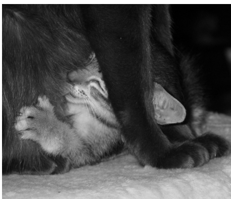
Mælkebaren er åben.

Jeg besluttede mig til at give mig rigtig god tid til at lede efter den rigtige hunkat til at starte mit opdræt op igen, men racen lå fast.