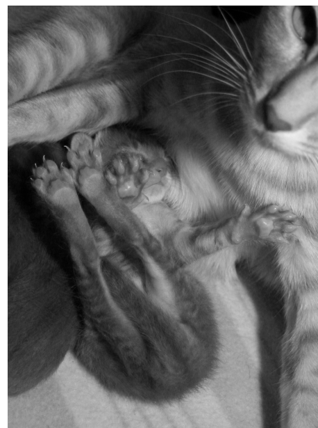
Sådan sover man godt.

voldsomt, når vi mister en kat, men Tokyo blev urolig og græd indtil jeg til sidst viste ham Mocca . Han stod længe med næsen på hendes hals og snakkede inden han vendte sig og gik. Herefter var han helt rolig.