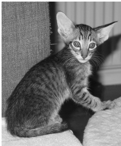
Sukhuthai of Lancarrow

Det tog mine forældre meget meget lang tid at overbevise mig om, at det altså ikke var en god idé at rejse rundt i verden med en kat. På grund af min fars arbejde flyttede vi ofte fra hotel til hotel, og jeg måtte modstræbende indrømme, at det nok ikke var de bedste betingelser for selv den mest intelligente kat. ØV ØV!