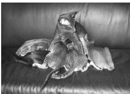
Zulaima har altid åbent i mejeriet

Med mere end 20 år på bagen uden den mindste erfaring med syge killinger, besluttede jeg mig alligevel til ikke at lytte, til hvad han sagde.