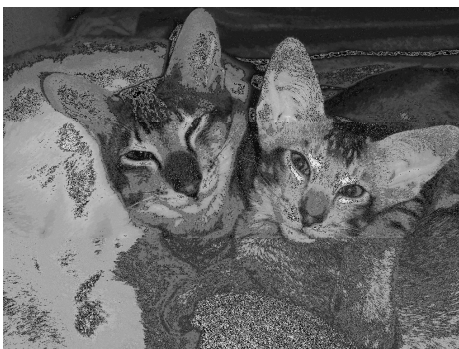
Tokyo med Nocciolo of Lancarrow

Jeg har ikke fået en forklaring, så det kan jeg heldigvis ikke underholde jer med. Faktisk var jeg besluttet på ikke at nævne noget overhovedet, men for det første er mit opdræt såvel som mit liv præget af vores 25-årige venskab og for det andet, er det jo noget der sker igen og igen i livet såvel som i kattesporten. Der var ikke langt fra: "Jeg ved ikke, hvordan jeg skulle kunne leve uden dig" til "Jeg vil aldrig tale med dig mere".