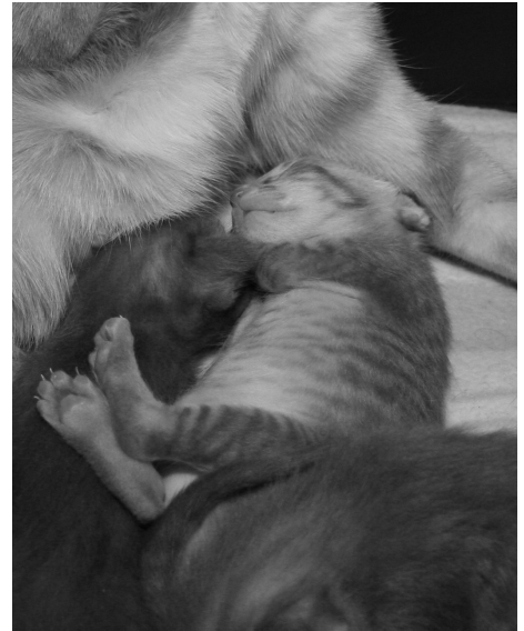
Jeg bliver aldrig træt af sådan et syn.