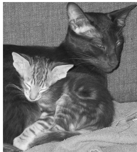
Kala og Savannah of Lancarrow