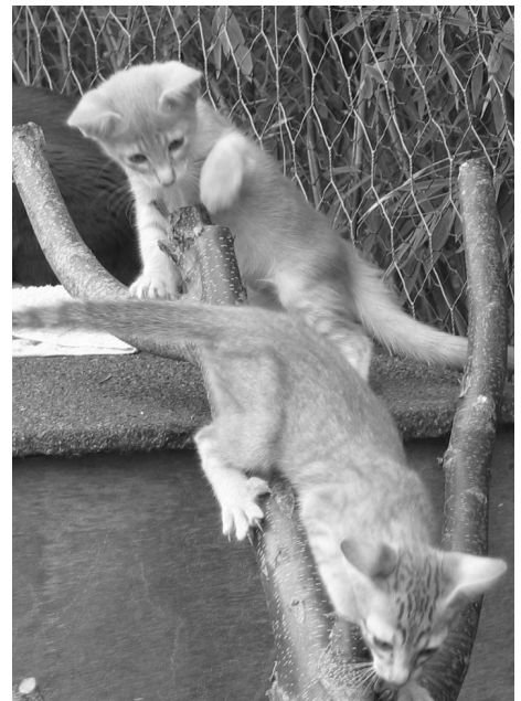
Zahara og Kenzo of Lancarrow

Piper ligner sin morfar Tokyo helt utroligt, og vadede lige ind i flokken som om hun altid har hørt til her. Både hjertet og fremtidsplanerne sagde ok.