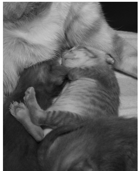
Jeg bliver aldrig træt af sådan et syn.

Det blev dog klaret med 5 kugler Platinum metallicum D-30 dagligt, der