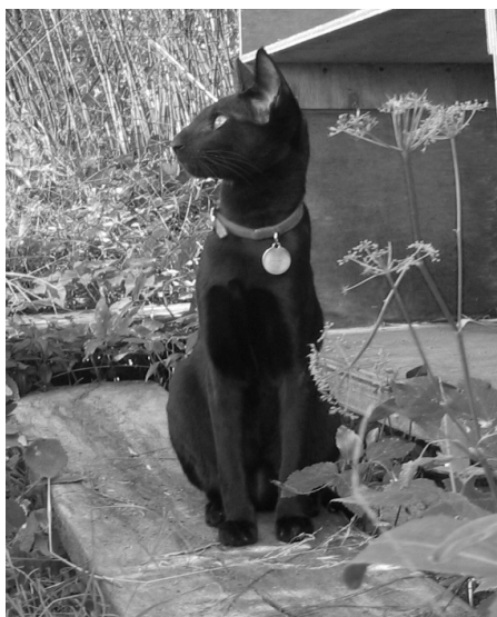
Chang Mai of Lancarrow

En fantastisk udstillings- og avskat var han angiveligt også, og jeg fik lov til at "få" en killing, da en nærboende Siam-opdrætter fik killinger med ham som far.