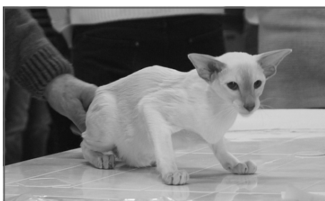
Nissen's Lara, juli 2010

han var nemlig ikke glad for at komme på udstilling. Nissen's Vimmer blev brugt til avl i mange år også hos andre opdrættere her og i Tyskland. Han har givet os rigtig meget godt afkom. Som tiden skred frem, blev vores opdræt en stor succes. Vi opdrættede næsten alle farver i siamesere og orientalerere. Vi tog på udstillinger i