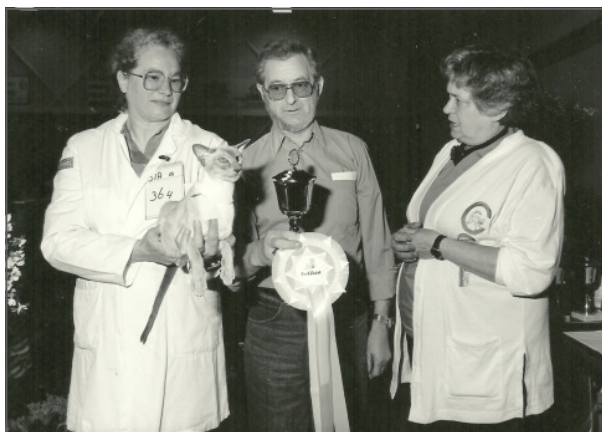
Nissen's Belladonna, BIS hun i Holland