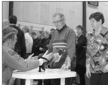
Nissen's Gao, Jyllinge 2011

Sidenhen har vi importeret "Feanorian's Bow Wow", købt i Nordfinland. Vi købte ham kun pga. farven. Vi vidste slet ikke, at han blev så fin. Han er blevet Supreme Champion og har er stadig fertil hankat. Han fik et kuld med "Nissen's Tamata". Her beholdt vi en blåmasket siameserhan, som vi kaldte "Nissen's Fonso". Det var et godt valg at beholde ham, for han har i dag også næsten vundet det hele. Han er topkat (på top 10) i både Tyskland og Danmark. Så fik vi et kuld mere med "Bow Wow". Der var 2 brunmaskede killinger, og den ene beholdt vi selv. Det er "Nissen's Gao", en rigtig flot kastrat.