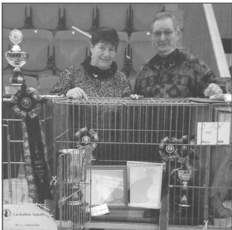
På Racekattens Topkatteshow 2001

han var nemlig ikke glad for at komme på udstilling. Nissen's Vimmer blev brugt til avl i mange år også hos andre opdrættere her og i Tyskland. Han har givet os rigtig meget godt afkom. Som tiden skred frem, blev vores opdræt en stor succes. Vi opdrættede næsten alle farver i siamesere og orientalerere. Vi tog på udstillinger i