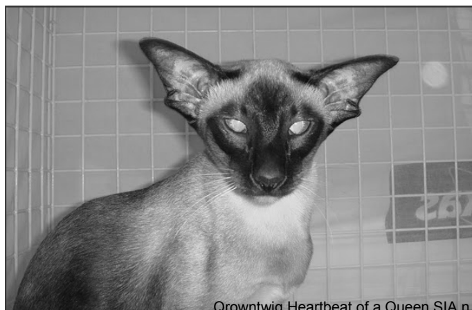
Crown twig Heartbeat of a Queen SIA n