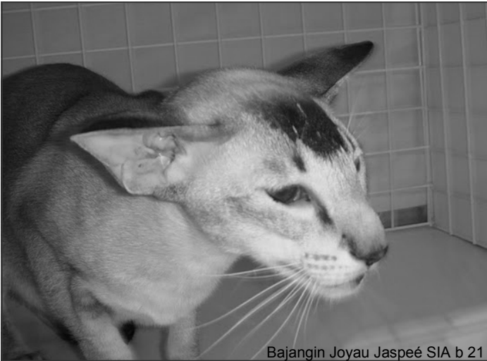
Bajangin Joyau Jaspéé SIA b 21