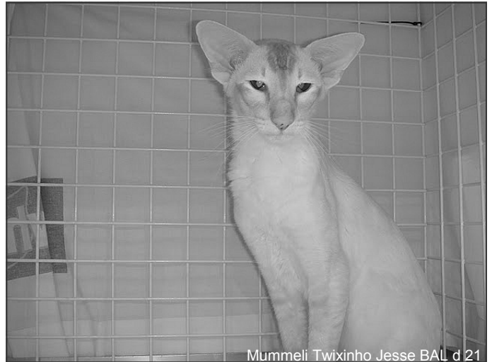
Mummeli Twixinho Jesse BAL d 21