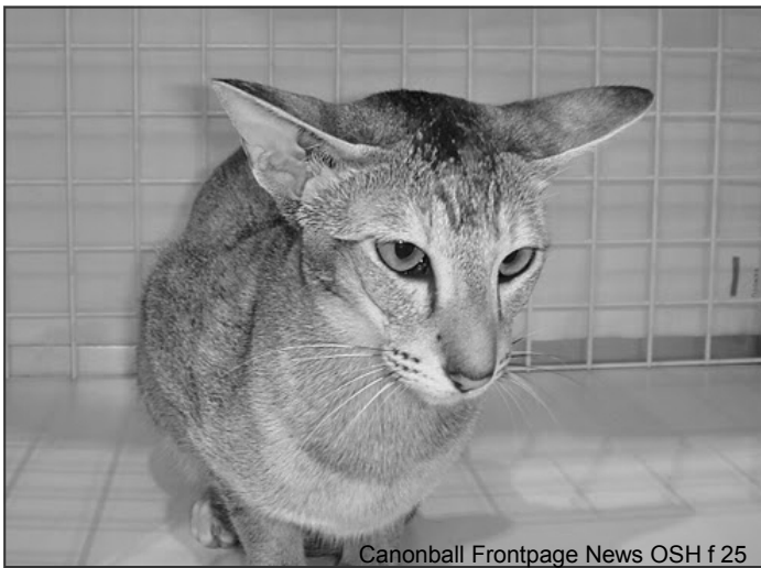
Canonball Frontpage News OSH f 25