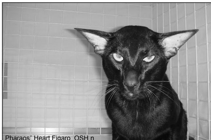
Pharaos' Heart Figaro OSH n