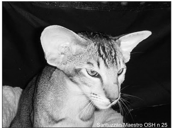
Santuzzan Maestro OSH n 25