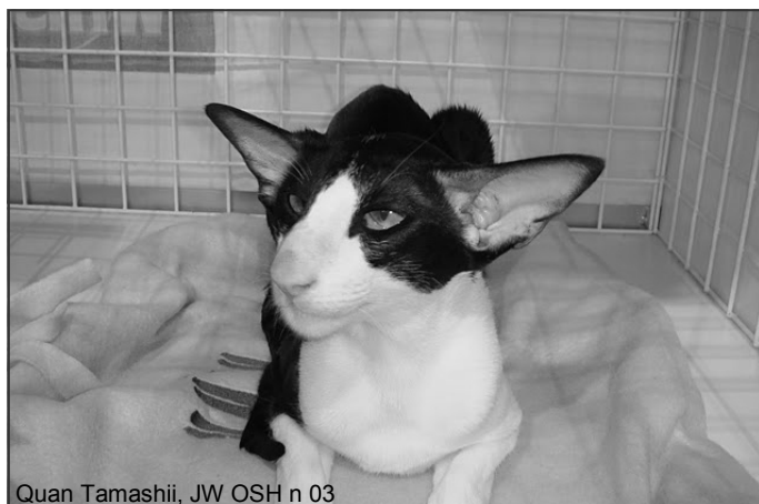
Quan Tamashii, JW OSH n 03