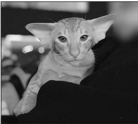
CH Jaguar Luana-Vodoley OSH d 24

en god grøn farve. Desuden er han dejlig spottet og med kort skinnende pels, så alt i alt en skøn kat. Den brunmaskede hankat Cesarion Amikoshi var lige blevet 1 år, og også han var i fantastisk flot kondition. Han er en lang elegant kat, højbenet og muskuløs med en lang lige profil, fin trekant samt en skøn dyb blå øjenfar-