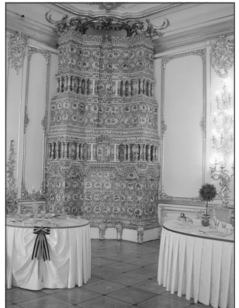
I Kavalier "spisestuen" står denne imponante kakkellov fra gulv til loft

bryn af den grund. Jeg er glad for, at jeg ikke skal køre der. Men heldigvis havde vi en god chauffør, der kender såvel skrevne som uskrevne regler i den russiske trafik, så også denne gang kom jeg godt hjem, og kunne se frem til næste besøg i Rusland, som var i december 2010 i Moskva.