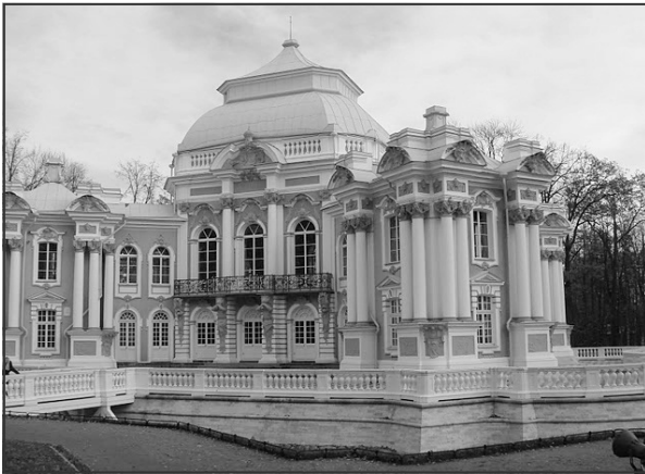
Pavillonen i haven

en god grøn farve. Desuden er han dejlig spottet og med kort skinnende pels, så alt i alt en skøn kat. Den brunmaskede hankat Cesarion Amikoshi var lige blevet 1 år, og også han var i fantastisk flot kondition. Han er en lang elegant kat, højbenet og muskuløs med en lang lige profil, fin trekant samt en skøn dyb blå øjenfar-