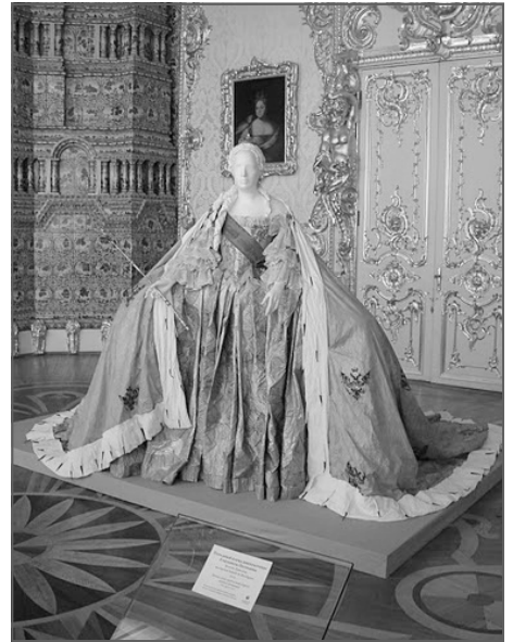
Skulptur af Kejserinde Elisabeth i original størrelse, lavet af en belgisk kunstner, i anledning af hendes 300 års fødselsdag i 2009

Da jeg skulle til lufthavnen mandag morgen, blev jeg hentet af den chauffør, vi havde kørt med mellem hotel og udstilling. I løbet af turen til lufthavnen fik flettereglen i øvrigt en helt ny betydning. Der er 5-6 baner i hver retning fra byen og ud mod lufthavnen, og folk skiftede snildt bane fra yderste til inderste bane i løbet af no time, uden at nogen løftede et øjen-