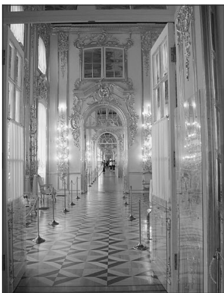
"Den gyldne gang", som går langs hele bygningen og forbinder de mange sale, er fantastisk smukt dekoreret med guldbelagte ornament