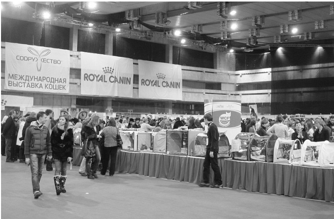
Royal Canin også i Moskva

Hallen var meget stor, men alligevel var det næsten ikke til at komme frem eller tilbage på grund af alle tilskuerne. Det forlød, at der var 25.000 tilskuere i løbet af weekenden.