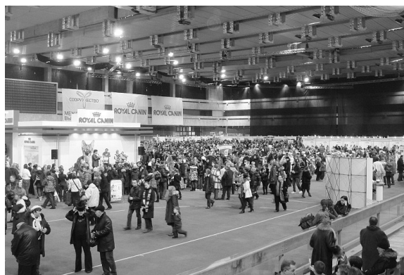
Kæmpe hal med Royal Canin bannere overalt

Lørdag aften blev der traditionen tro afholdt dommermiddag, og her var alle dommerne fra de øvrige forbund også med – alt sammen betalt af RC. Det russiske køkken er ikke den store kulinariske oplevelse – der er en masse forskellige salater til at starte med, de fleste lidt "tunge" i det (også rent bogstaveligt) og så serveres der en kød- eller fiskeret og måske en kage eller is til dessert. Til gengæld mangler der ikke drikkevarer. Da vi kom til bordet, stod der adskillige halvliters vodka og når en flaske var tømt, blev den hurtigt skiftet ud!! Heldigvis var det ikke så stærkt, så ingen