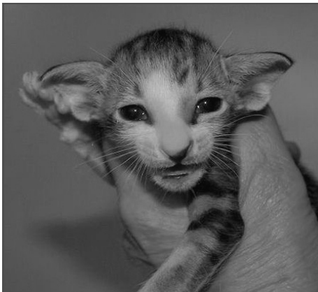
Winnetou's første bicolour

Lad mig begynde med begyndelsen af mit opdræt, som går helt tilbage til slutningen af 1970'erne, ellers vil det nok ikke give så megen mening for dem, som måtte læse dette her. Det var netop i starten af mit opdræt, at jeg lærte at sætte pris på netop de ting, som i dag anno 2012, snart 2013, jeg stadigvæk bruger som en rettesnor i mit opdræt og det, jeg ønsker at få frem i mine siam/orientaler.