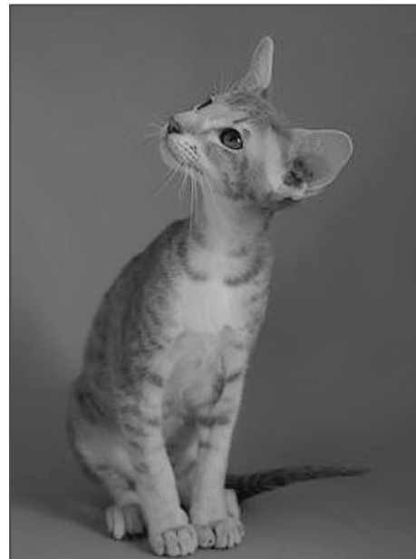
Winnetou's Winter Wishes

Det vigtigste for en ny opdrætter er at gøre sig selv den tjeneste at finde ud af, hvad vil jeg egentligt med mit opdræt, hvordan kunne jeg ønske mig,