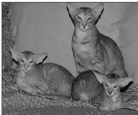
Kuld efter Hugo Bon Voyage & Winnetou's Jasmin

Nej, det er ikke vejen frem, men det er en god stabil stamtavle, det er også en sådan, der laver en show vinder, for disse udstillingskatte har jo både en far og en mor. Så er det, at man går bagom stamtavlen og ser og lærer, hvor kom denne skønne kat dog fra, fra 1.-2.-3. eller sågar 5. led i stamtavlen!!!!