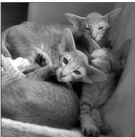
Kuld efter Hugo Bon Voyage & Charmese Amazon Emma

Netop de 2 har med deres stamtavler og gener vist en evne til at præge deres afkom i heldig retning uanset hankattens type og stamtavle. Titte har jo været død i mange år nu (25 år), men Emma lever i bedste velgående, og forhåbentligt mange år endnu, begge er katte, jeg med omhu har udvalgt specielt på deres stamtavler. Alle mine avlsdyr, om det er ren siam, orientaler eller mit sølv opdræt, vælger jeg ud fra de stamtavler, jeg synes om, jeg går efter andet og mere end et par ører. Når man udvælger sit avls materiale, er det afgørende vigtigt at vide, hvad man selv ønsker, hvad ens mål er, ikke i morgen eller om en uge, en måned eller så, men 1-2-5, ja 10 år frem i tiden. Når jeg skriver én selv, så mener jeg helt klart én selv og ikke, hvad synes den og den, og nu var der jo den flotte hankat eller den hunkat, der vandt på sidste udstilling, og jamen hankatten