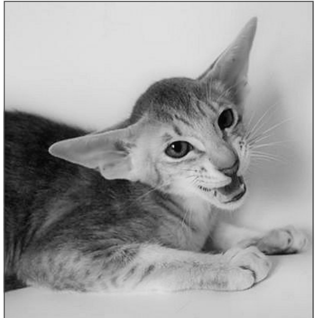
Winnetou's Pastel StripesN'Diamond