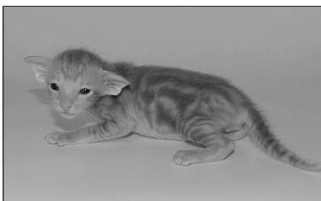
Lille han efter Fearbhairl Markus & Winnetou's Butterfly

Det startede alt sammen med siameseren (Baronessen Blanche' SIA n 21). Min mor, som senere fik stamnavnet "Frederiksværk", fik denne hunkat foræret af sin nabo. Hun havde købt både en sort perser og denne siam hun, men de kunne ikke enes, så de ville af med Blanche', min mor sagde ja ..og katten levede hos min mor i lang tid.