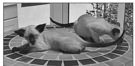
Winnetou's Sealed With a Kiss, som killing