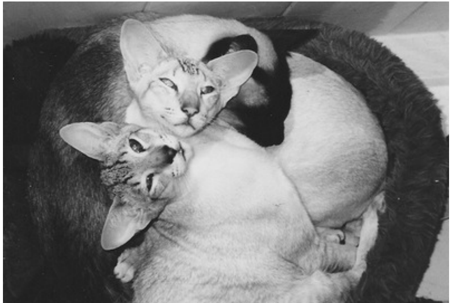
Dan-Thai Uptodate og Dan-Thai Ugly Duckling