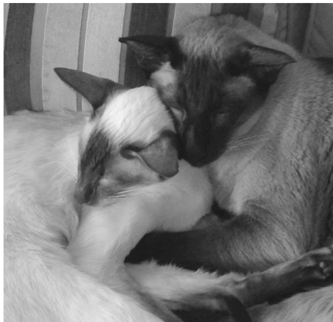
Eclair og Elthon