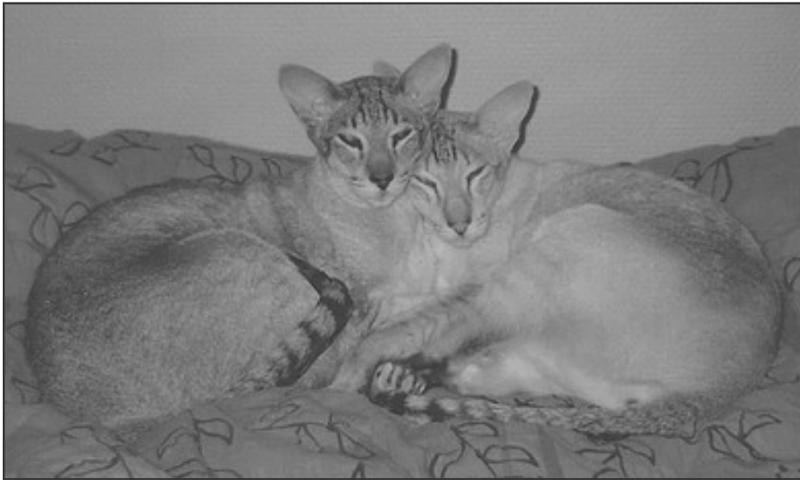
Uggy og Date