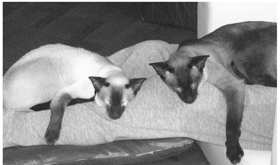
Eunice og Elthon