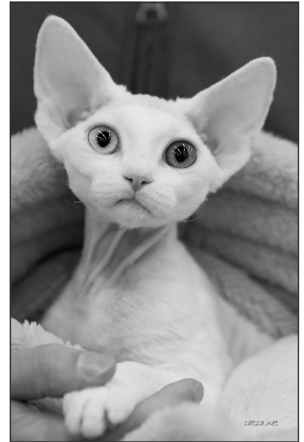
Devon Rex DRX

eneste race i FIFe, der ifølge standarden skal have meget store og meget lavt placerede ører! Pelsen tæller også her 35 point, så pelsen er også meget vigtig, hvorimod der kun er 20 point for kroppen. Ifølge FIFe reglerne skal en kat dømmes i forhold til sin alder, og det nyder Devon Rex'en godt af. Det er nemlig sådan, at en Devon killing ofte mangler pels som killing og ungdyr, ja, nogle gange så kan de se helt hårløse ud. Derudover