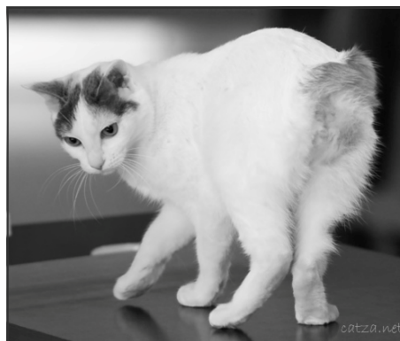
Japanese Bobtail JBT

Russian Blue er den eneste af de racer, vi bliver slået sammen med, der kun findes i en farve nemlig blå. Den har 35 point totalt for hovedet, 30 point for kroppen samt 30 point for farve og pelsstruktur. Her er hovedet det vigtigste, men igen da det er i forhold til 30/30, skal alle detaljer være på plads. Derudover er det en elegant kat med lang krop og høje ben. Dens pelstruktur er også speciel, og i standarden beskrives den som værende meget forskellig fra alle andre racer. Sidst men ikke mindst, har Russian Blue også mandelformede intense grønne øjne, og farven beskrives på samme måde som farven på Orientaleren eneste forskel er,