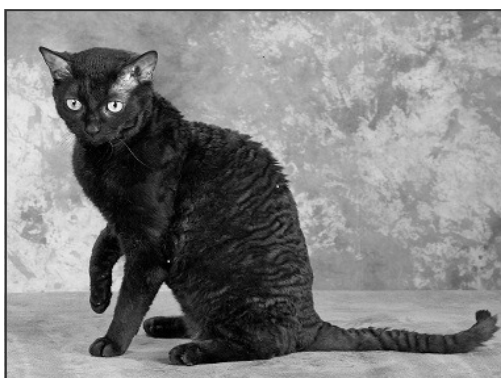
German Rex GRX

Som før nævnt i artiklen, er Japanese Bobtail også en orientalsk kat med et trekantet hoved, men modsat vores katte, er den ikke godkendt med majske. Den skal også fremstå som ele-