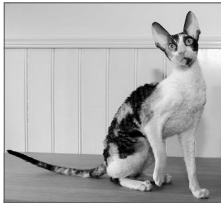
Cornish Rex CRX

For Devon Rex'ens vedkommende ligger de fleste points, nemlig 40, i hovedet, og her er der også tale om en ekstrem kat. Det er for øvrigt den