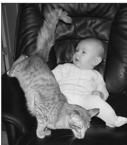
Hunkat i løbetid søger hjælp

At være opdrætter og mor til en 19 måneder gammel terrorist, kan af og til godt bringe nogle grå hår frem. Det kommer nok ikke som nogen overraskelse, at børn i 1½ års alderen nok ikke lige er de blideste. Heldigvis er det sådan, at det er killinger heller ikke altid, så der passer de jo perfekt samme. Både børn og killinger skal undersøge alting, og til tider kan jeg godt få den opfattelse, at de planlægger deres gøren og laden.