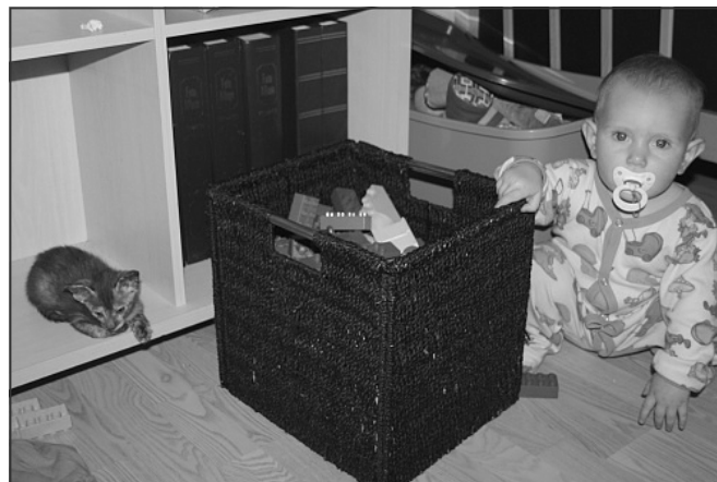
Hvem hygger sig mon mest?

enten hun har holdt den i hovedet, eller lige under det ene forben. Her er det så, at et normalt menneske ville tænke "Jamen for pokker da de stakkels kræ. De lærer vel at holde sig fra det modbydelige minimenneke..." – men