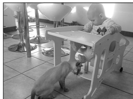
Ingen lider nogen sult her.....