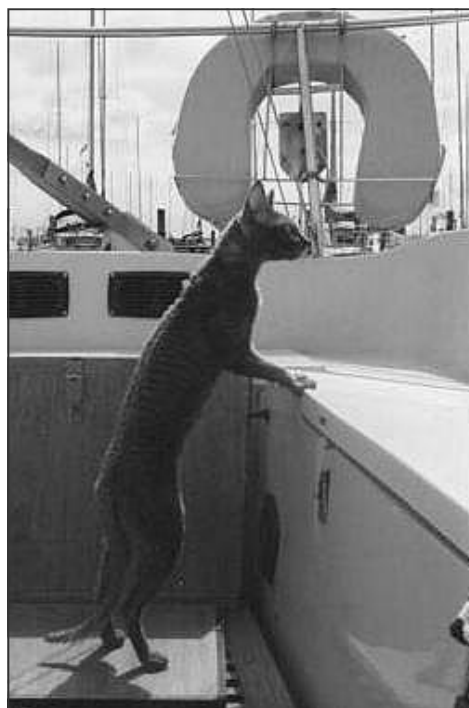
Jourdans blue Dubi Sjælland rundt

Kattene tog sejlturene som det naturligste i verden. Kun var de ikke så vilde med den snor, jeg absolut ville have i deres sele. Vi tog dagsture mellem havnene rundt om Sjælland for, at jeg kunne stige af med kattene,