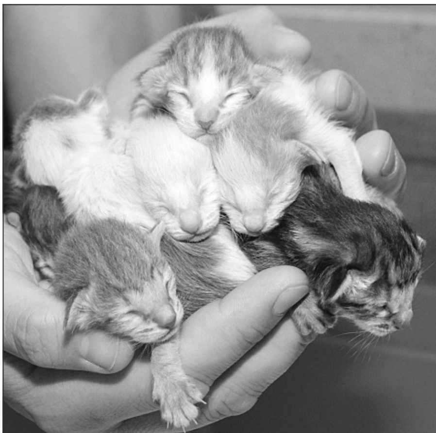
De 7 små dværge 2013

og hver gang syntes hun, at han var både dum, grim og ulækker. Så fandt hankattens ejer på at holde hende for øjnene og den erfarne hankat så hurtigt sit snit til at bestige damen. Tre sunde og lækre killinger blev resultatet, og vi var glade.