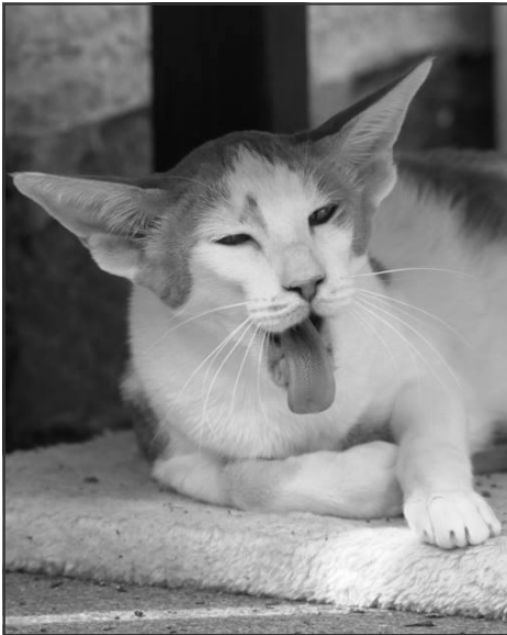
Jazzminh of Lancarrow

hvis de ikke kunne tåle turen, men selv de dage, hvor halvdelen af den menneskelige besætning lå med grønne hoveder ud over rælingen, gik de glade rundt på båden. Om aftenen gik vi tur i havnen, og som for alle, der har været ude at gyngede hele dagen på en båd, var det som om vi gyngede på den faste bådebro. Bjarke sprang tilbage på båden, og gik sin aftentur fra båd til båd. Pludselig løb han fra mig og havnede midt i et fødselsdagsselskab på en større båd. Jeg sprang op på båden og forsøgte undskyldende at fange min kat.