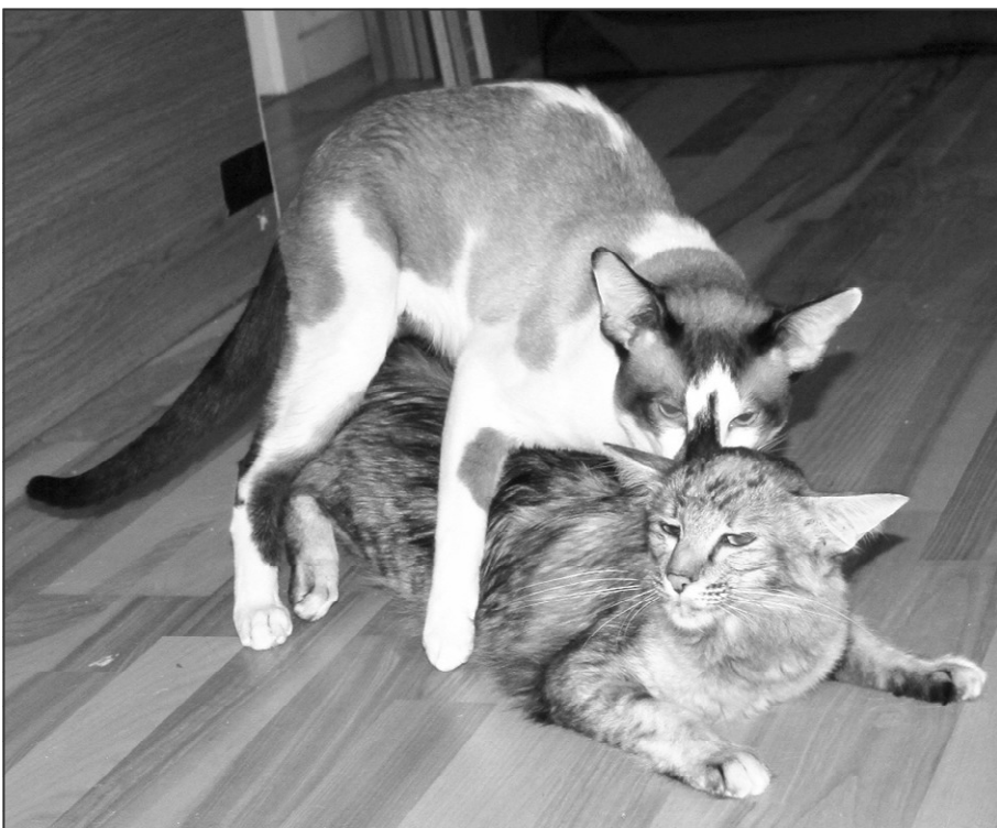
Porthos i gang med at sørge for de næste killinger hos Lancarrow