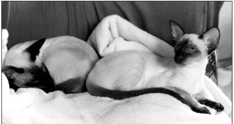
Feli er gravid og Daisy til højre er 4½ måned

Efter 3 dage var der, i et par dage, en lille optakt til noget, der kunne blive til en løbetid, men på tredje dagen forsvandt det igen. Samme opførsel gentog sig et par gange med 14 dages mellemrum, og derefter forløb de næste 4 uger uden bemærkninger. Hun tog hurtigt den tabte vægt på igen, og som 7 måneder gammel havde hun en fin vægt på 3,4 kg og var en stor, sund og velafbalanceret hunkat. Præcis 11 uger efter chippen blev