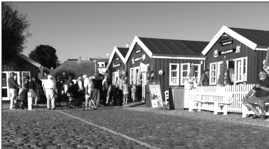
Vores ishus "Nysted Mole"

Sommeren gik, og jeg fik min "lille" store Felicita hjem, og alt var vel indtil dagen, hvor Felicita gav et brøl fra sig, vi troede, at hun var blevet stuk-