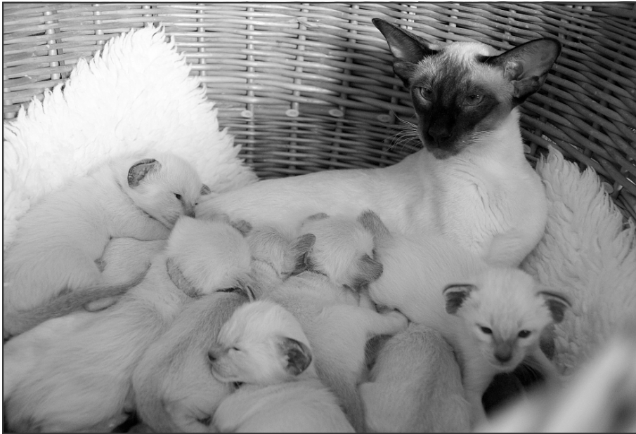
Felicita, stolt og dygtig mor med 7 killinger

Det gav sandelig også et flot resultat, nemlig 7 dejlige killinger, som vi nu i skrivende stund glæder os over. De trives og vokser lige efter bogen, og Feli er en "supermor", ligesom hendes mor og mormor, der også begge fik store kuld, som de opfostrede uden problemer.