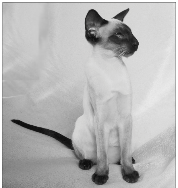
Daisy knap 6 måneder

var der velkendte lyde under spisebordet. Taylan blev da også rost for sin indsats, for hvis denne "kastratparring" var god nok, ville det jo give 7 ugers fred, og en lille besparelse i pengepungen på 250 kroner, for det koster chippen nemlig. Og jo, den var såmænd god nok, Taylan kan godt "kastratparre", det nød vi godt af igen efter 7 uger, da gentog scenariet sig nemlig igen. Nu var Felicita i mellemtiden blevet 11 måneder og en stor og statelig pige på 3,8 kg, så nu gjaldt det om at være på vagt, for nu skulle hun ved næste løbetid på date med sin "udkârne". Nåh ja det var mig, der havde "kâret", men hun var nu meget tilfreds med valget. I de par dage hun besøgte den flotte statelige herre på Nordfalster, blev der parret så mange gange, som jeg i min tid som opdrætter ikke havde hørt om før ☺