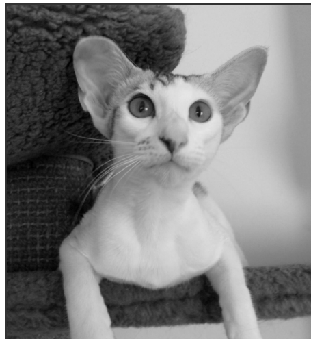
"Das Trunte" fra Tyskland

Sami synes, hun var KLAM, men spændende og overgav sig hurtigt. De gamle drenge Dr. Dre og Turbo kunne ikke og kan stadig ikke udstå hende, men lader hende være, de 3 *unge* tøsolerere hende (11 og 9 år), resten elsker hende. Hun så underlig ud, sagde mærkelige lyde, og blæste højt og flot på afvisninger og møvede sig bare ind der, hvor der nu var plads og poterne ikke slog. Trunten elsker alle og forventer det samme af andre.