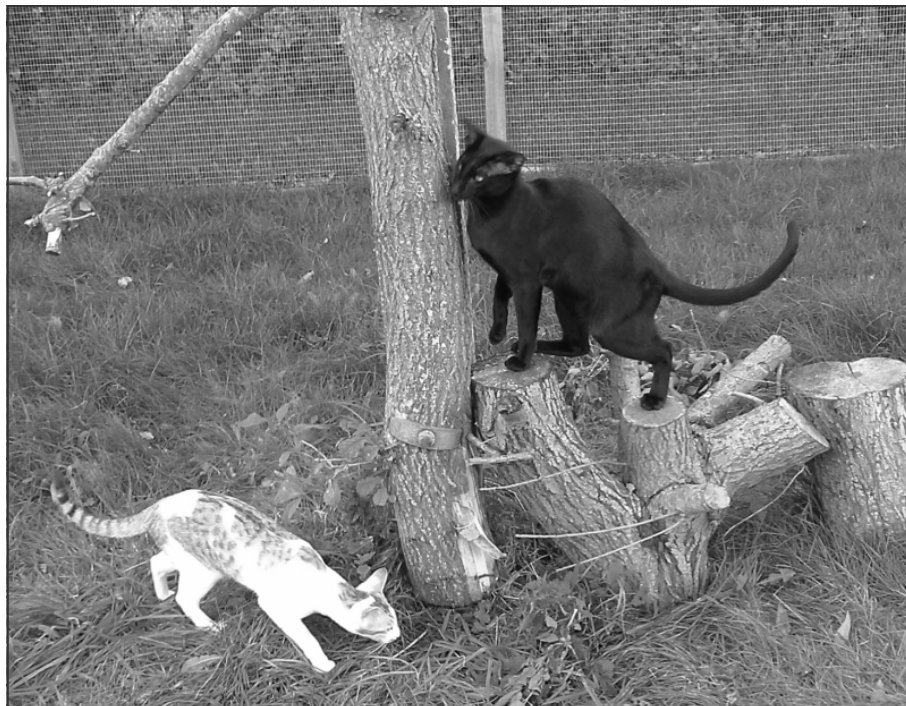
Ser træer sådan ud i Danmark?

Heldigvis har man lov til at blive klogere,