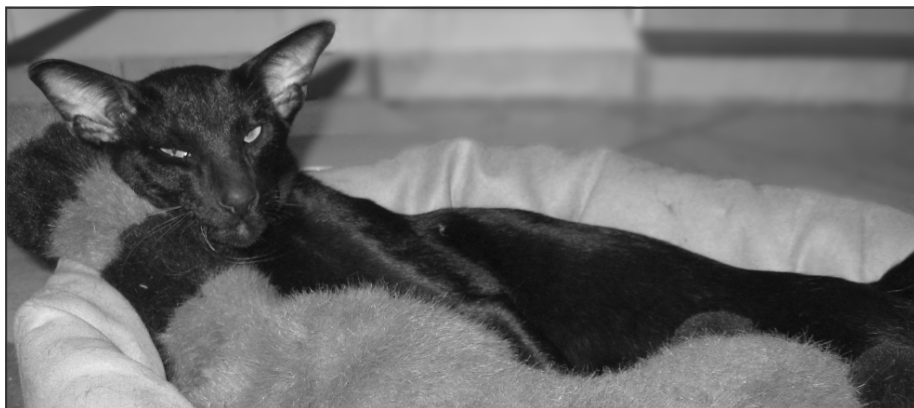
Nissen's Sambo - i daglig tale Sami

Jeg er blevet spurgt om samarbejdspartnere og mentorer, men jeg har ingen af delene. Nogle mennesker har jeg oplevet tage sig til brystet og hive efter vejret, for det er lidt kutyme, at sådan nogle har man. Jeg har bare ikke. Jeg har al-