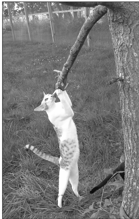
Laaaang spraglet kat

Jeg var begyndt at nørde stamtavler, og det fangede mig øjeblikkeligt, jeg synes det er piv spændende og hånden på hjertet, så æder det bare rigtig meget tid. Men den lille piges tavle var der også fremtid i, og hun lovede godt, så når jeg nu havde taget springet med Sami, så kunne jeg ligeså godt fortsætte, og