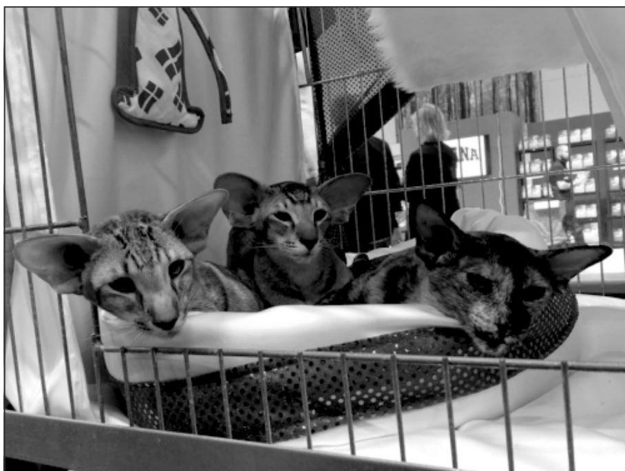
3 generationer Lessie, Ticky og Butsy, i deres flotte rød/hvide danske bur

Også hos hankastraterne var konkurrencen hård, så Lessie's bror FLO fik sit certifikat og kom heller ikke videre. Til gengæld blev en anden lækker danskejet hunkastrat nomineret ved en anden dommer - PR IC Shagio-Chen Zanzibar, så der var da lidt at heppe på næste dag.