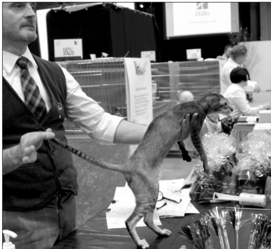
På dommerbordet hos Mantovani

Butsy blev bedømt af Thea Friskovec og fik sit udenlandscertifikat uden problemer, men gik ikke videre – måske ikke så underligt taget i betragtning at en af konkurrenterne var en anden danskopdrættet hunkastrat, der var flere gange verdensvinder – WW'14'13'12 NW IP SC Filihankats Bella Notte, JW, DSM (der næste dag fik WW15 hæftet på sig også).