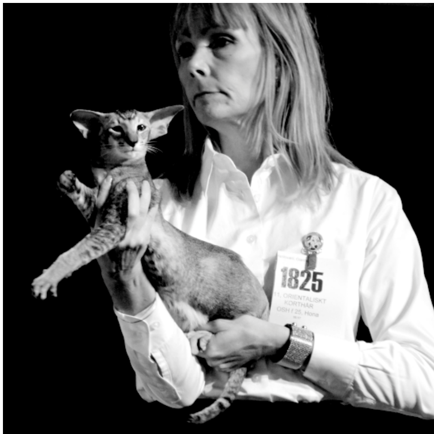
Om et ganske kort øjeblik udløses spændingen

Bagefter blev jeg sendt ned til fotografering og hen til stedet, hvor jeg skulle modtage mine præmier. Og hold da op hvor svenskerne havde haft travlt med at skaffe sponsorpræ-