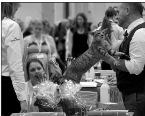
Tickys bror, Manhunter's For Ladies Only