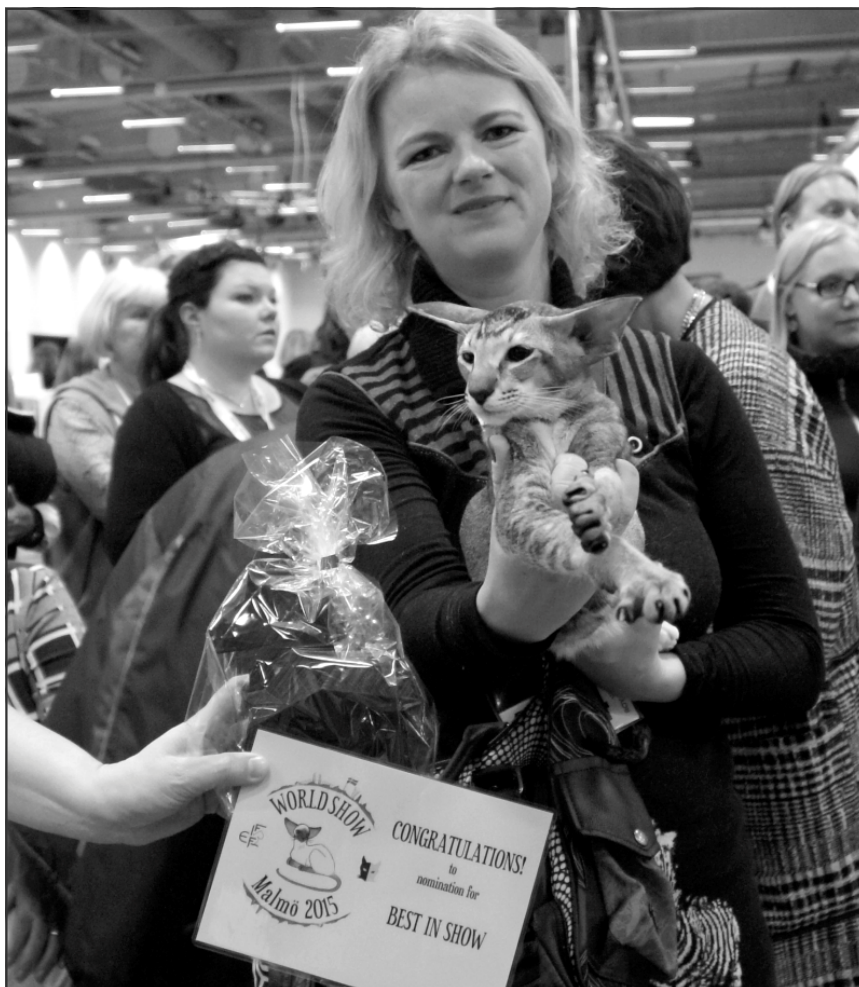
Netop nomineret .....