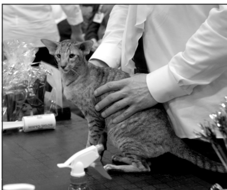
Tickys mor, IC Manhunter's Less is More, JW