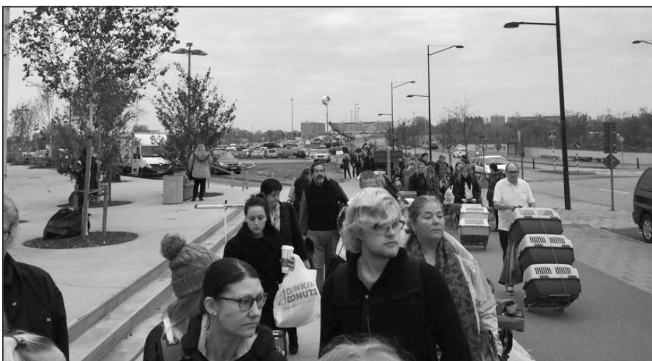
Ankomst til hallen lørdag morgen

mens mine 3 piger fik lov at være på værelset med os. Især Butsy syntes, det var en fest og holdt os vågne det halve af fredag nat ved at hoppe fra den ene til den anden. Vi var i forvejen ankommet lidt sent fredag aften og kommet sent i seng, så vi var lidt trætte, men alligevel glade og spændte, da vi mødte op på udstillingen lørdag morgen.