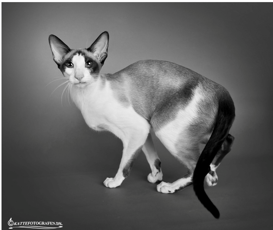
Devanchi Gold Osten SIA n 03