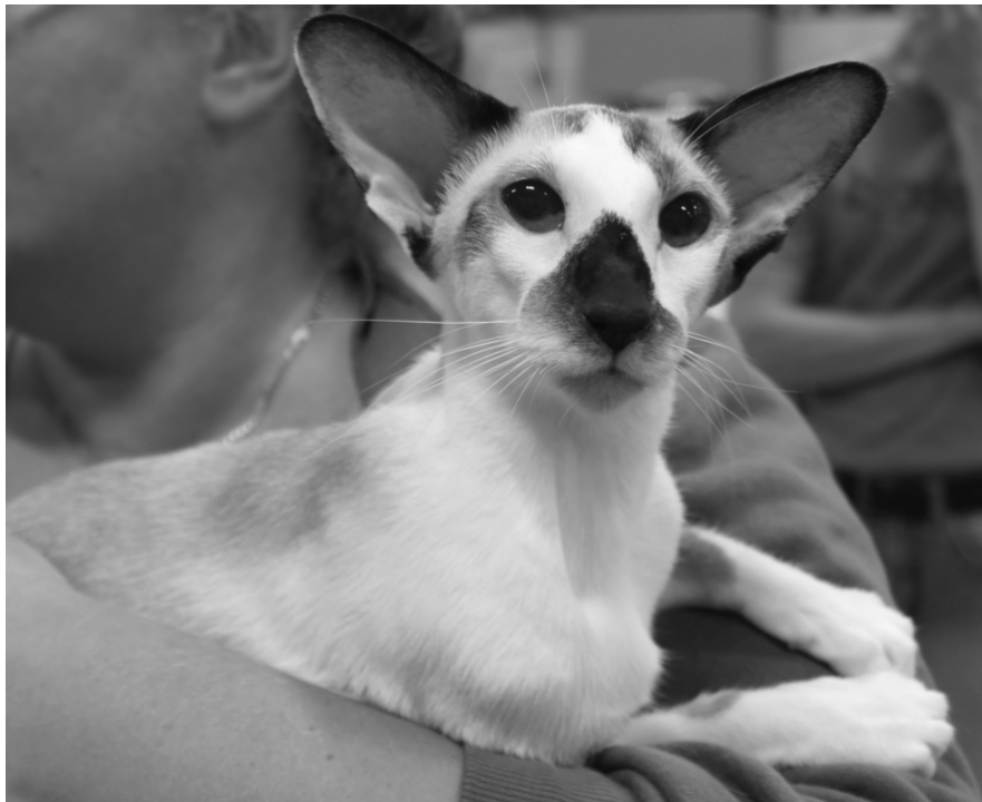
TetraFeline's AbraCadabra SIA n 03

Der er selvfølgelig også efterhånden en vis portion stædighed med i programmet. I starten fik vi mange kommentarer om, hvor fjollet dette program var, hvordan man håbede, at de aldrig blev godkendt, at opbakningen blandt dommerne i FIFe var lig nul osv. osv. Nu er det efterhånden blevet sådan, at nu vil vi altså gøre det færdigt. Vi vil bringe det fornødne antal katte frem til en godkendelse, og så kan man sige nej til den tid, men projektet skal køres igennem. I svage øjeblikke når alt går skævt - et kejsersnit kl. 24:00 lørdag nat og næsten alle killinger dør, - når der kun kommer silverkatter i et kuld, - osv. - så har tanken strejft os: Hvad kunne vi dog ikke foretage os for alle de penge, vi bruger på det her?