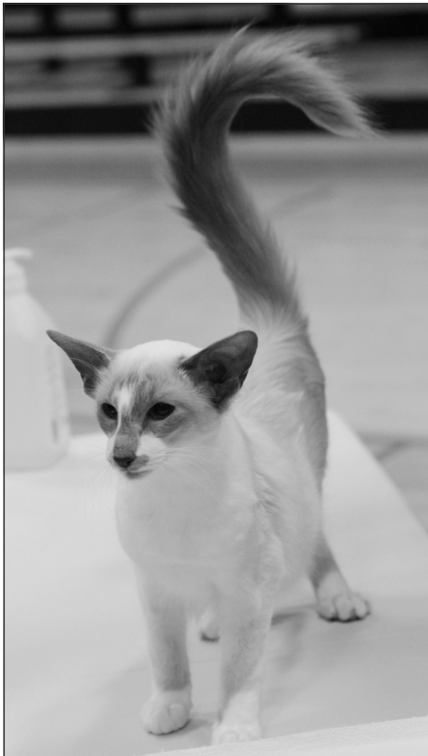
SE*Torpakattens Benedictine BAL a 03