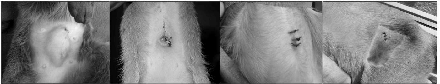
Allergisk reaktion på den indvendige selvopløselige tråd