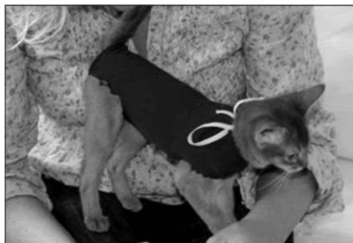
Bodystocking model til en killing på 16-17 uger – en micofiber sok var stor nok til hende

Den bløde krave er ikke særlig anvendelig til små katte – de falder i den. Den skal bindes meget stramt i halsen for at blive på