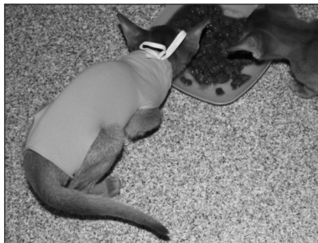
En ca. 14 uger gammel killing netop hentet hjem efter sterilisering – allerede helt vågen og sulten