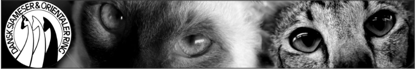
Logoet fra den nye hjemmeside, der blev lanceret i 2014

Hjemmesiden har også været et af Heides store hjertebørn, hvilket altid har kunnet aflæses i frekvensen af opdateringer. Så sidst men ikke mindst, så fik DSO en ny hjemmeside, der blev præsenteret på generalforsamlingen i 2014.