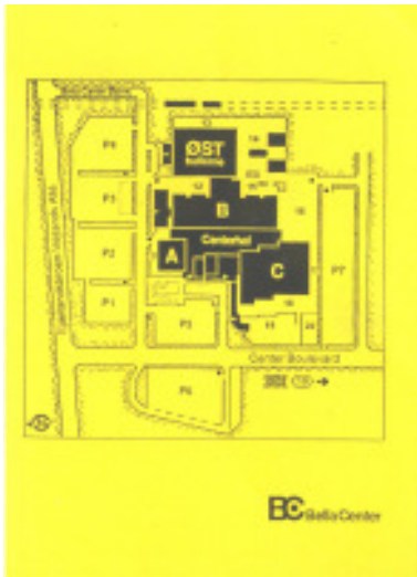
Parkeringsbillet med oversigt over hallerne

Det være sagt med det samme: Showets sejrskatte blev korthårskattene Aby'er og Rex'er.