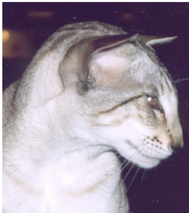
WW 02, 03 SW 02, 03 S*La Bell Leo, SIA n21