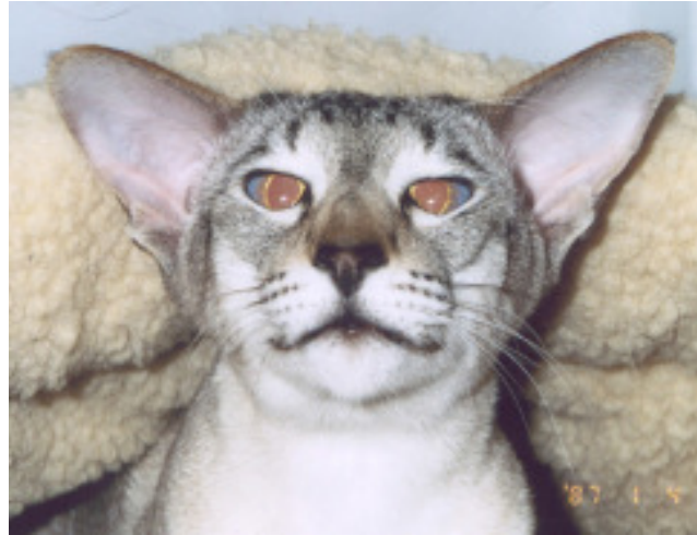
WW 02, 03 SW 02 S*Alien's Tequila Sunrise, SIA n21

Verdensvinderen fra 2001 og 2002 gjorde det igen og kunne føje et WW 2003 til titelrækken. Han var en fantastisk powerfull sortticktabby orientaler (ori n 25) med det imponerende navn Kattilan Ilmari Itäinen. Denne finske hankat har enorme ører, stort kraftfuldt hoved og vidunderlige grønne øjne og er én af de katte, jeg aldrig vil glemme. Afkom efter ham gjorde det også meget flot. En fertil datter blev WW (BOX) og to hankatte efter ham blev nomineret.