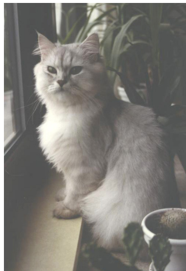
Kiddie - en silvershaded Chinchilla perser.

Min første oplevelse med racekatte var i 1989, da jeg som ganske ung, bare 19 år, flyttede til Odense for at studere. Vi havde altid, hjemme hos mine forældre, haft kat, og det var med stor sorg, jeg måtte forlade min højtelskede kridhvide huskat, Dixie. Derfor måtte jeg straks have mig en lille killing. Jeg købte "den blå avis" og faldt over en 10 uger gammel hun chinchilla perser. At hun så