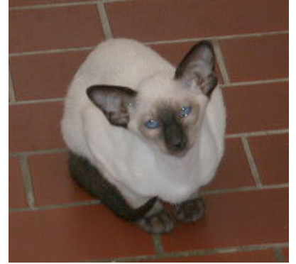
Den sidst ankomne siameserpige fra Klingeskov's

med hende. Det bliver ikke nemt, med de få "rene" linjer der er tilbage, men vi synes, at de skal bibeholdes, så derfor dette tiltag.