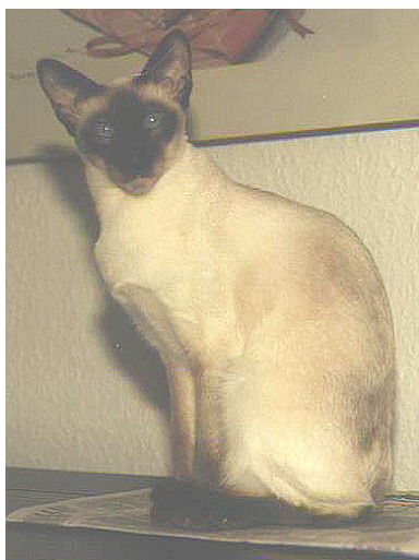
Klingeskov's Skiath, SIA f