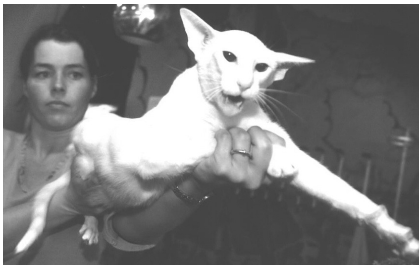
SKuld Menja, SIA d