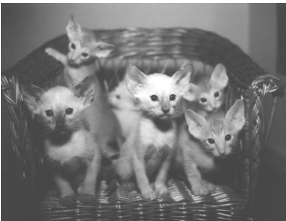
Kuld E - efter Bellamis Finlandia & Skuld Menja

Det næste tiltag fra vores side er, at få parret Torin og Durin. Så der skulle gerne komme nogle dejlige killinger herefter i sensommeren!