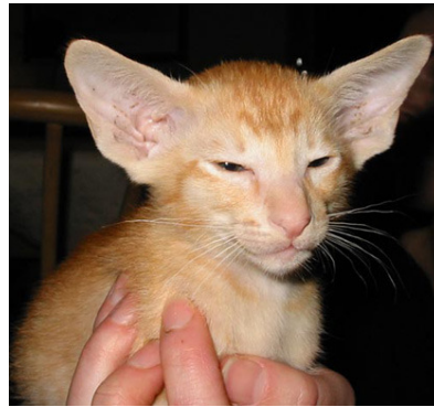
Rød Orientalisk Korthår's killing fra Menja's sidste kuld.